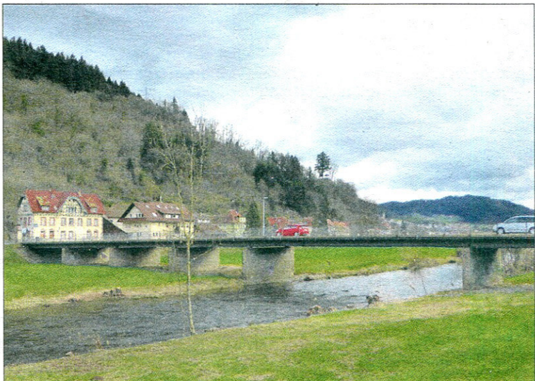
Die Arche-Brücke ist marode und wird für den Schwerlastverkehr gesperrt. Der wird jetzt durch Schnelllingen geleitet.