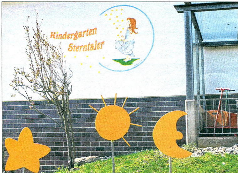
Historische Entscheidung: Der Hofstetter Kindergarten wird neu gebaut. Das Projekt wird die Gemeinde lange beschäftigen.